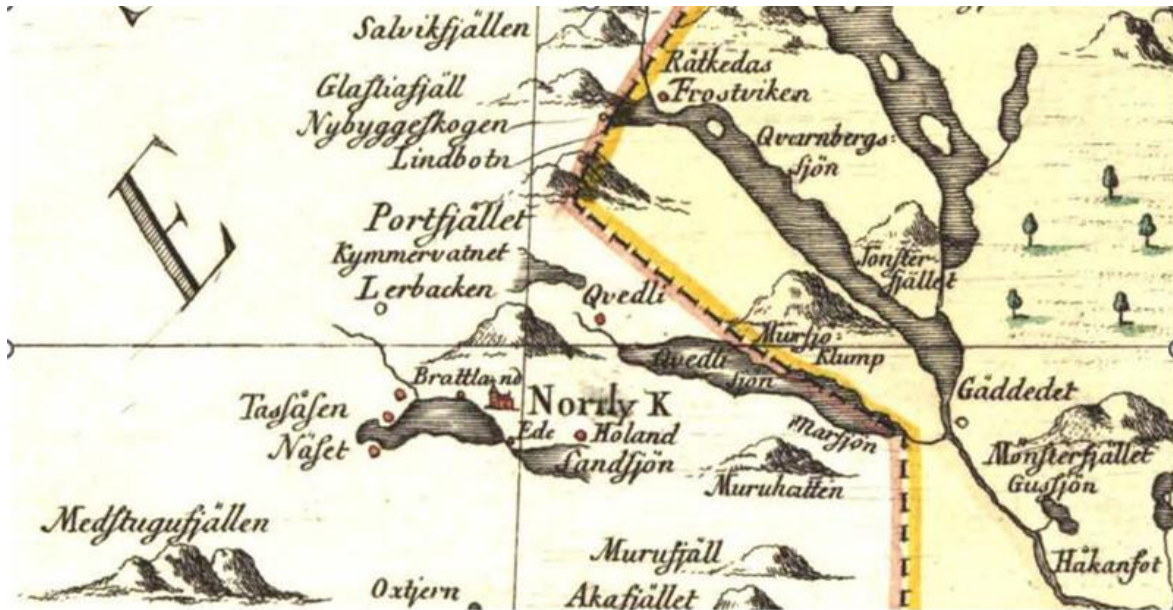
Fig. 8. Utdrag från karta över Västernorrland från 1771. Här är den kända gårdsbebyggelsen markerad med röda punkter. På svensk sida är ännu endast Frostviken bebyggt (registrerat).